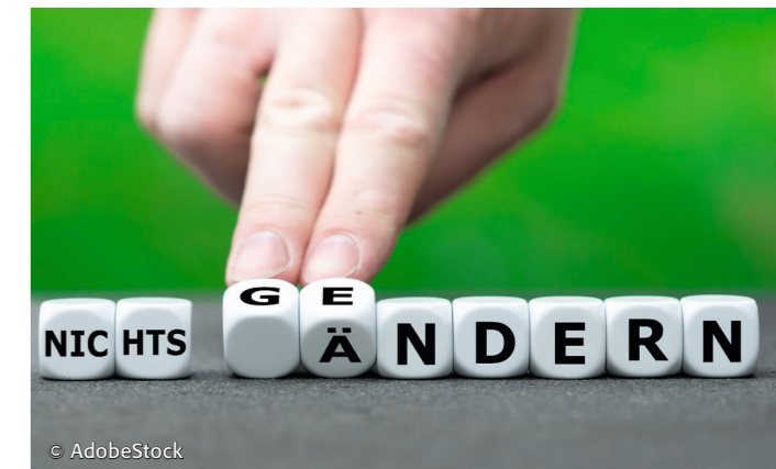
Kein Gendern in der Stadtverwaltung – im Übrigen haben wir andere Probleme zu lösen.