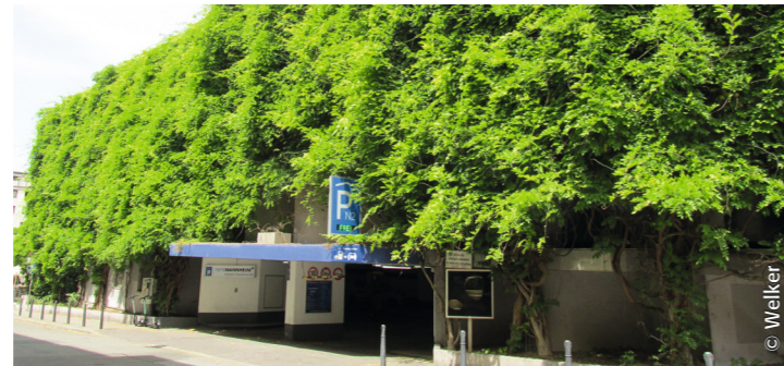
Mehr grüne Fassaden – Parkhaus N2 erhalten.