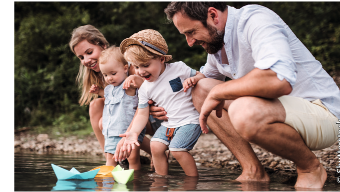
Wir stehen für eine lebenswerte Stadt mit attraktiven Stadtteilen.