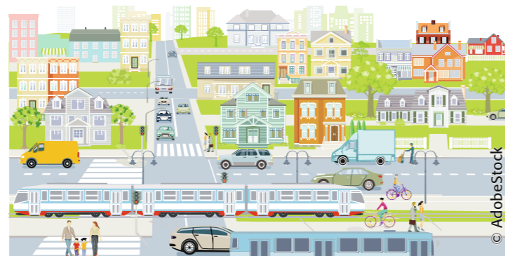
Eine ideologiefreie Verkehrspolitik muss alle Verkehrsteilnehmer berücksichtigen.